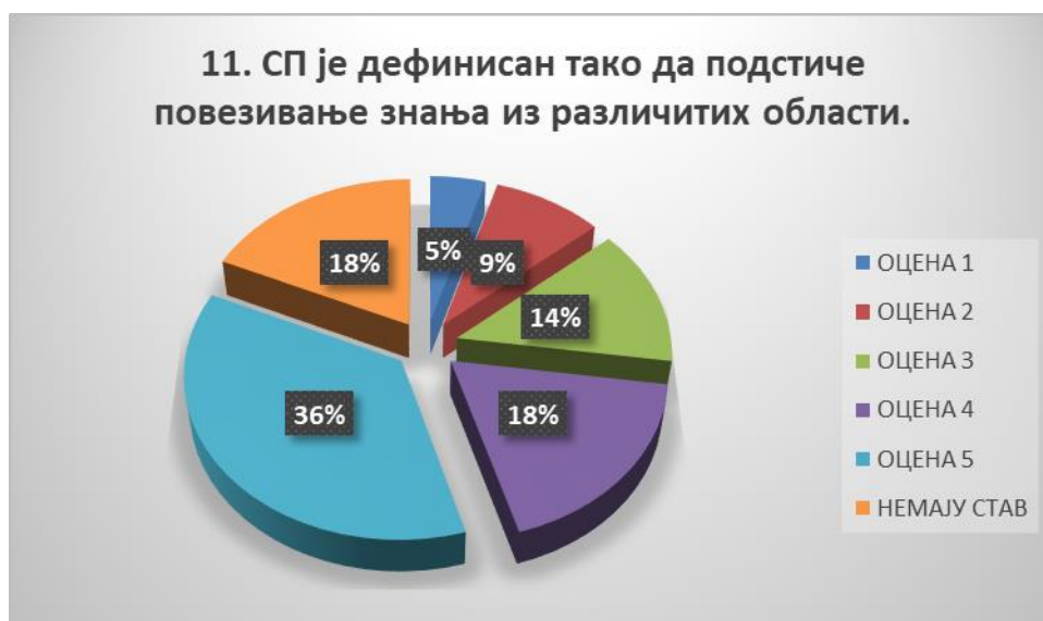
Сл. 3.11 Графикон 11

Средња оцена свих одговора износи 3,89. Број оцена које премашују просек (оцене 4 и 5) чине око 67 % одговора. Број ниских оцена (оцене 1 и 2) чине око 17 % одговора. Општи закључак: Испитивани показатељ квалитета СП је високо оцењен.