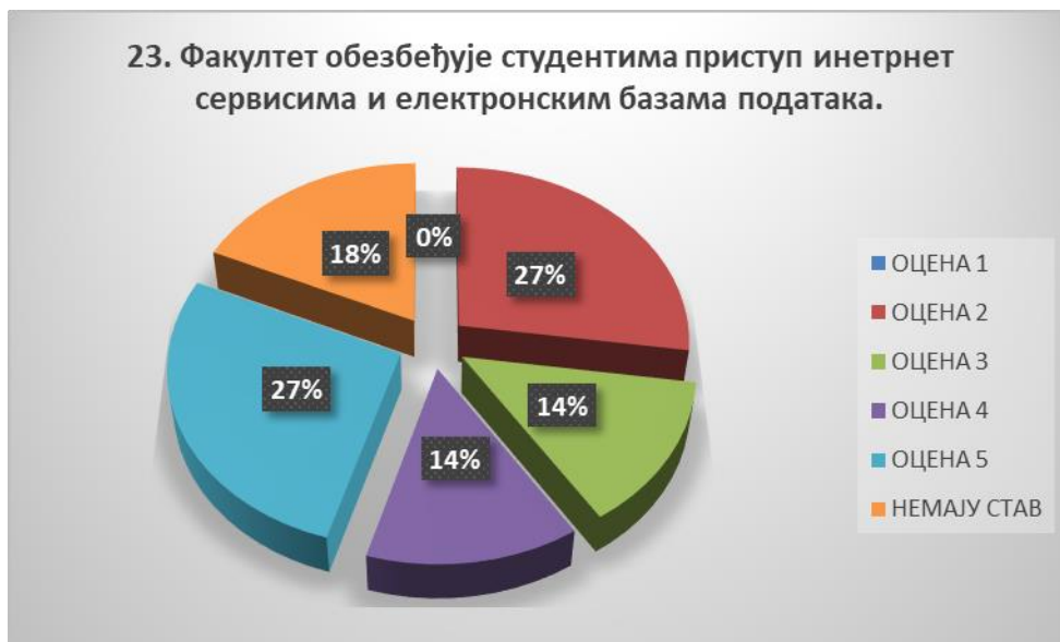
Сл. 3.23 Графикон 23