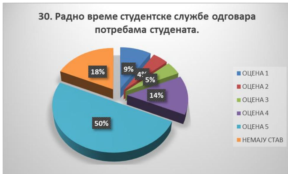
Сл. 3.30 Графикон 30

Општи закључак: Испитивани показатељ квалитета СП је врло високо оцењен.