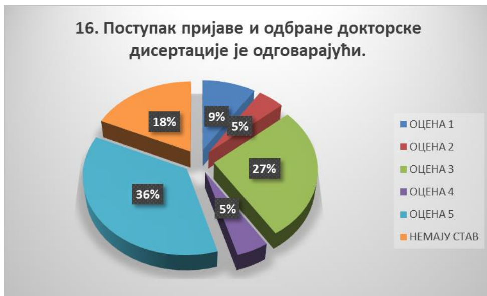
Сл. 3.16 Графикон 16

Општи закључак: Испитивани показатељ квалитета СП је високо оцењен.