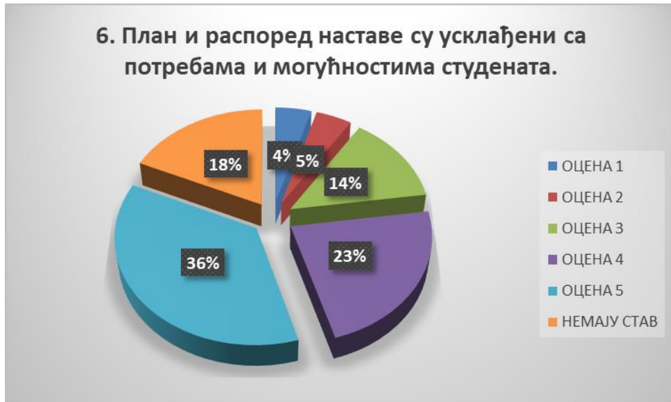
Сл. 3.6 Графикон 6