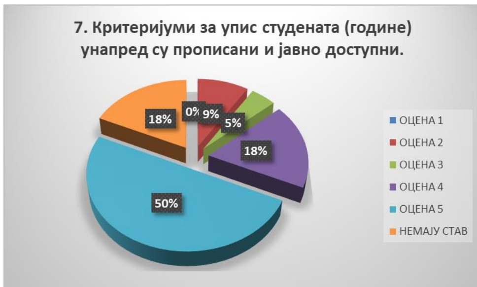
Сл. 3.7 Графикон 7

Општи закључак: Испитивани показатељ квалитета СП је врло високо оцењен.