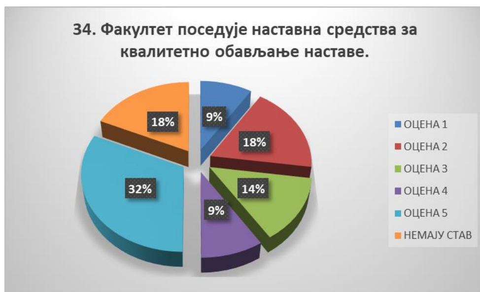
Сл. 3.34 Графикон 34

Општи закључак: Испитивани показатељ квалитета СП је задовољавајуће оцењен.