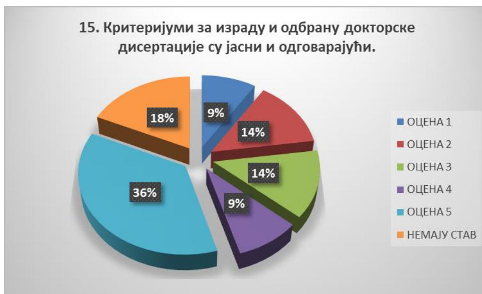
Сл. 3.15 Графикон 15

Општи закључак: Испитивани показатељ квалитета СП је високо оцењен.