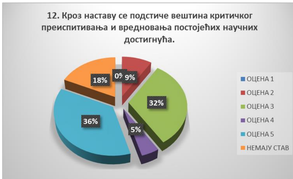
Сл. 3.12 Графикон 12

Општи закључак: Испитивани показатељ квалитета СП је врло високо оцењен.