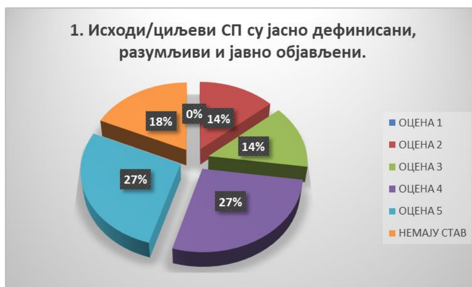
Сл. 3.1 Графикон 1

Општи закључак: Испитивани показатељ квалитета СП је високо оцењен.