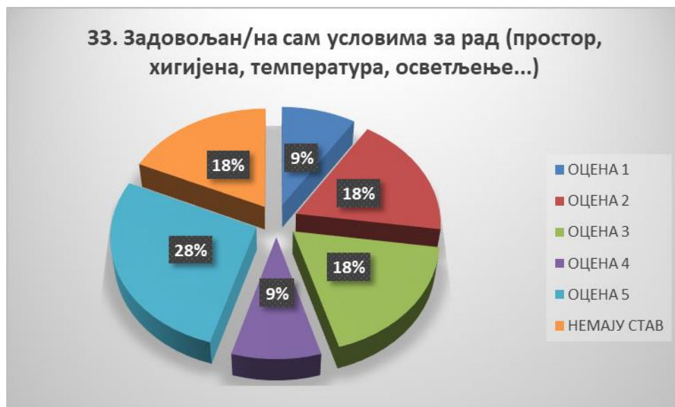
Сл. 3.33 Графикон 33

Општи закључак: Испитивани показатељ квалитета СП је задовољавајуће оцењен.