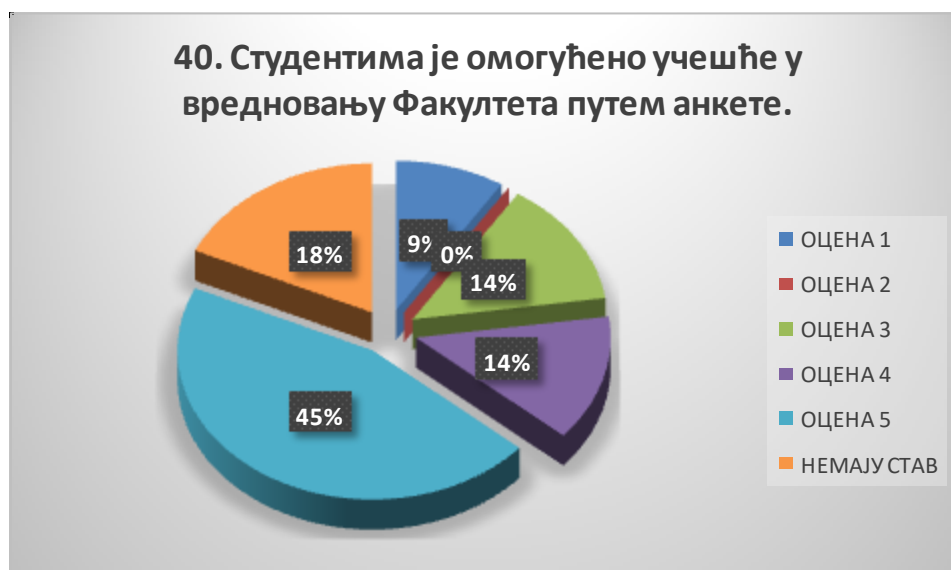
Сл. 3.40 Графикон 40

Општи закључак: Испитивани показатељ квалитета СП је врло високо оцењен.