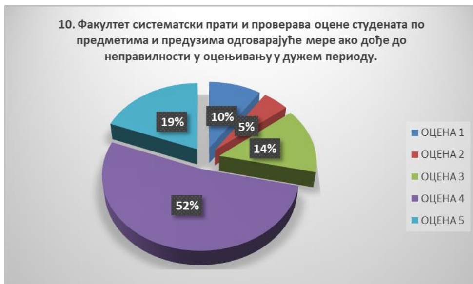
Сл. 3.10 Графикон 10

Број оцена које премашују просек (оцене 4 и 5) чине око 78 % одговора. Број ниских оцена (оцене 1 и 2) чине око 17 % одговора. Општи закључак: Испитивани показатељ квалитета СП је врло високо оцењен.