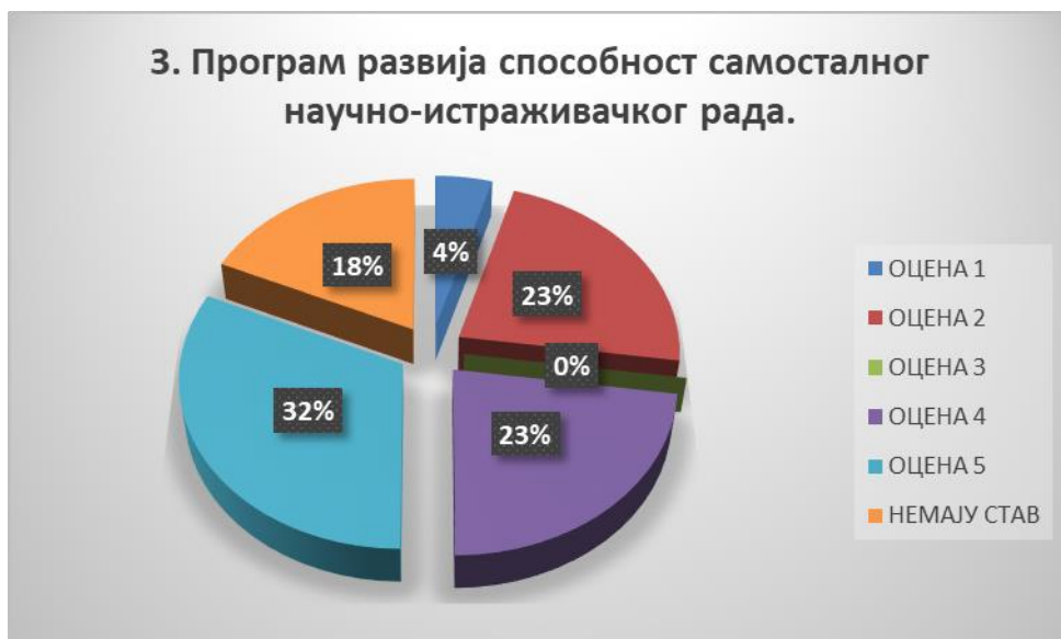
Сл. 3.3 Графикон 3

Општи закључак: Испитивани показатељ квалитета СП је високо оцењен.