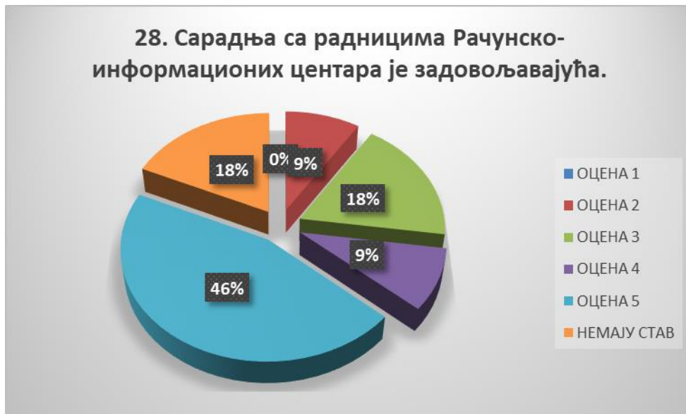
Сл. 3.28 Графикон 28

Општи закључак: Испитивани показатељ квалитета СП је врло високо оцењен.