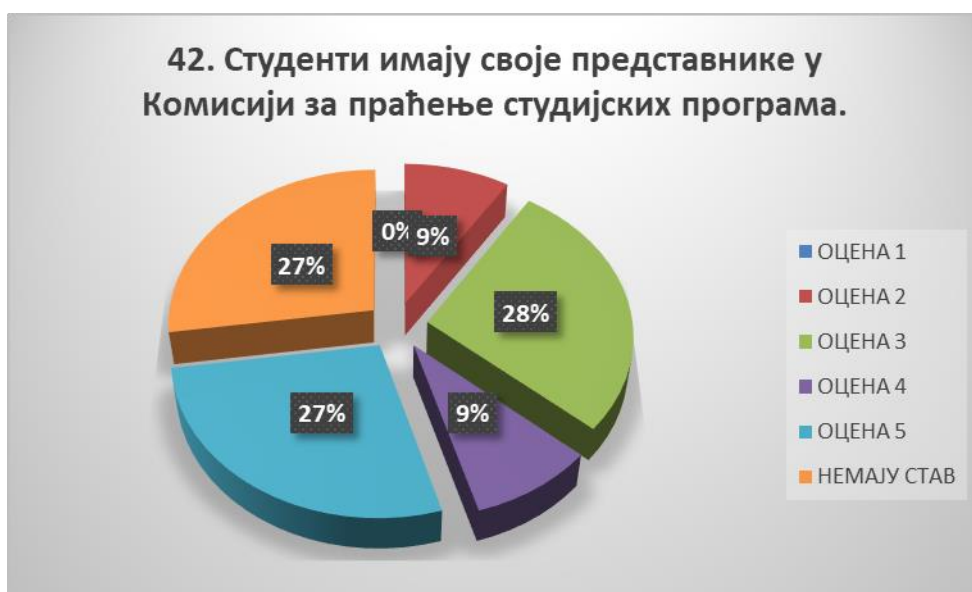
Сл. 3.42 Графикон 42

Општи закључак: Испитивани показатељ квалитета СП је високо оцењен.