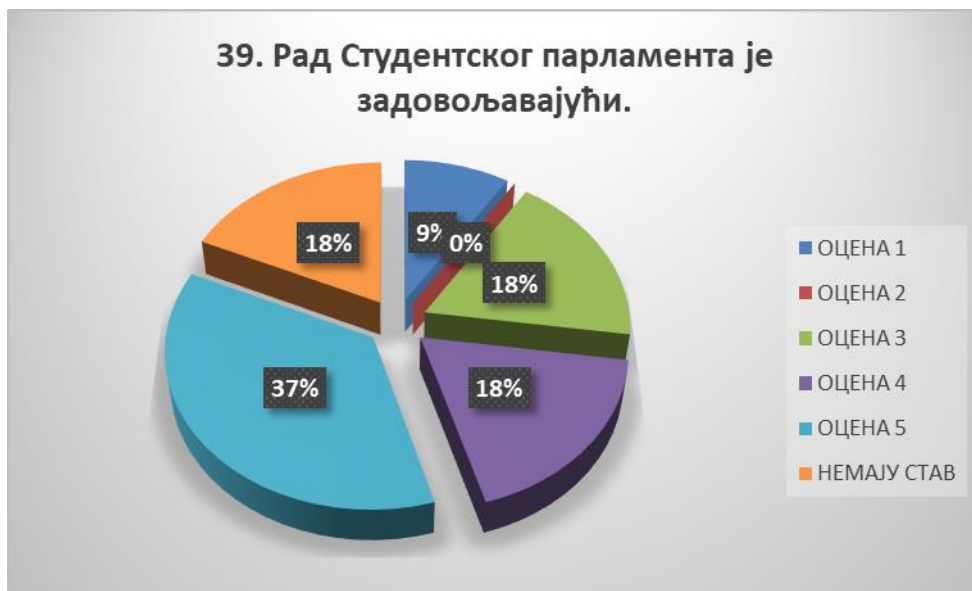
Сл. 3.39 Графикон 39

Општи закључак: Испитивани показатељ квалитета СП је високо оцењен.