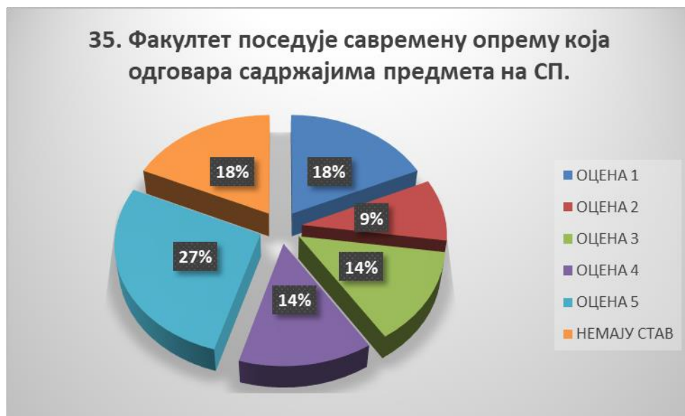
Сл. 3.35 Графикон 35

Општи закључак: Испитивани показатељ квалитета СП је задовољавајуће оцењен.