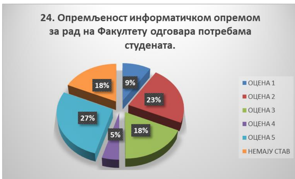
Сл. 3.24 Графикон 24

Општи закључак: Испитивани показатељ квалитета СП је задовољавајуће оцењен.