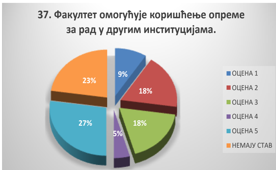
Сл. 3.37 Графикон 37

Општи закључак: Испитивани показатељ квалитета СП је задовољавајуће оцењен.