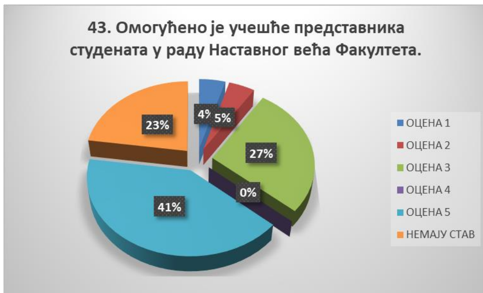
Сл. 3.43 Графикон 43

Општи закључак: Испитивани показатељ квалитета СП је високо оцењен.