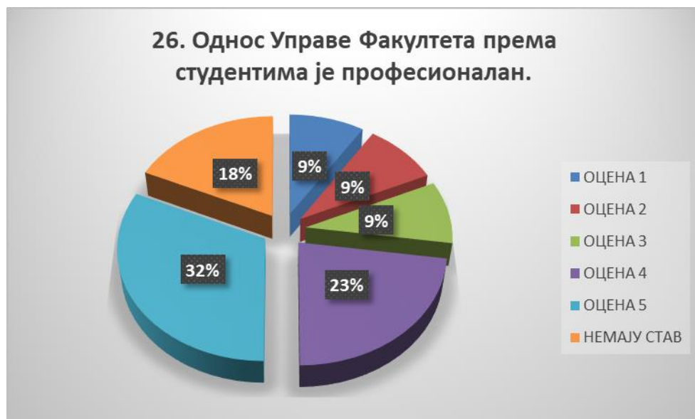
Сл. 3.26 Графикон 26

Општи закључак: Испитивани показатељ квалитета СП је високо оцењен.