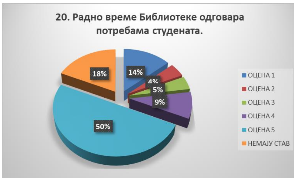
Сл. 3.20 Графикон 20

Општи закључак: Испитивани показатељ квалитета СП је високо оцењен.