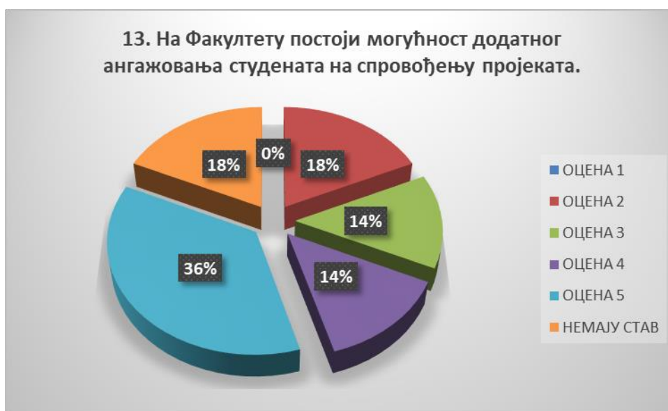
Сл. 3.13 Графикон 13

Општи закључак: Испитивани показатељ квалитета СП је високо оцењен.