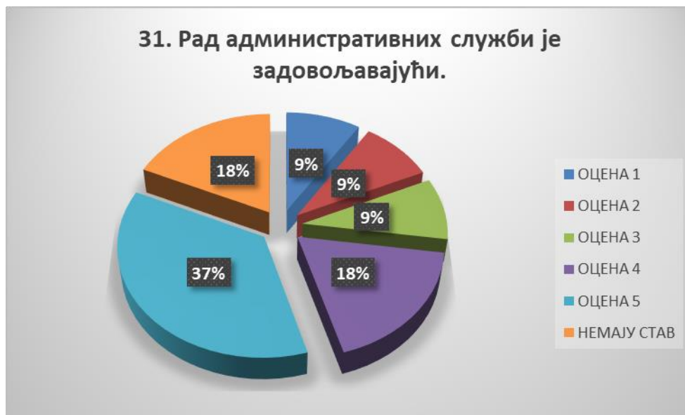
Сл. 3.31 Графикон 31

Општи закључак: Испитивани показатељ квалитета СП је високо оцењен.