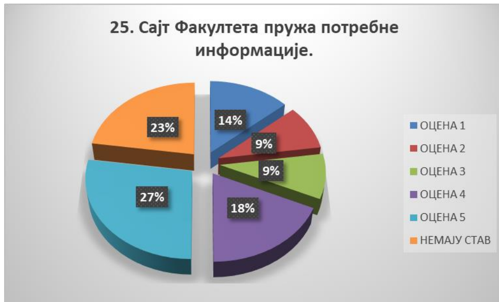
Сл. 3.25 Графикон 25

Општи закључак: Испитивани показатељ квалитета СП је задовољавајуће оцењен.