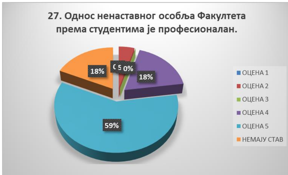
Сл. 3.27 Графикон 27

Општи закључак: Испитивани показатељ квалитета СП је изузетно оцењен.