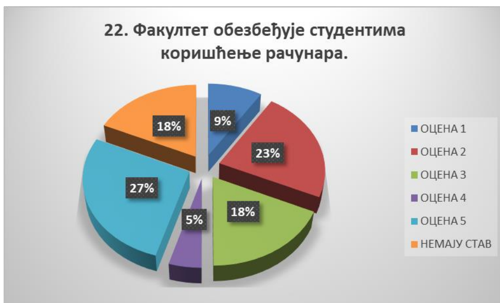
Сл. 3.22 Графикон 22

Општи закључак: Испитивани показатељ квалитета СП је задовољавајуће оцењен.