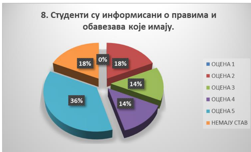
Сл. 3.8 Графикон 8

Општи закључак: Испитивани показатељ квалитета СП је високо оцењен.