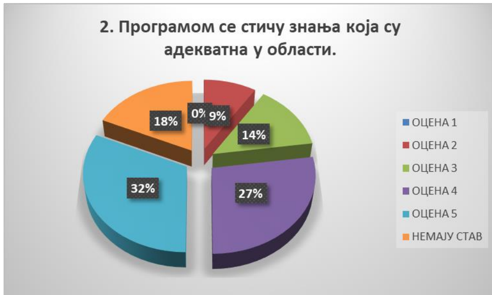
Сл. 3.2 Графикон 2