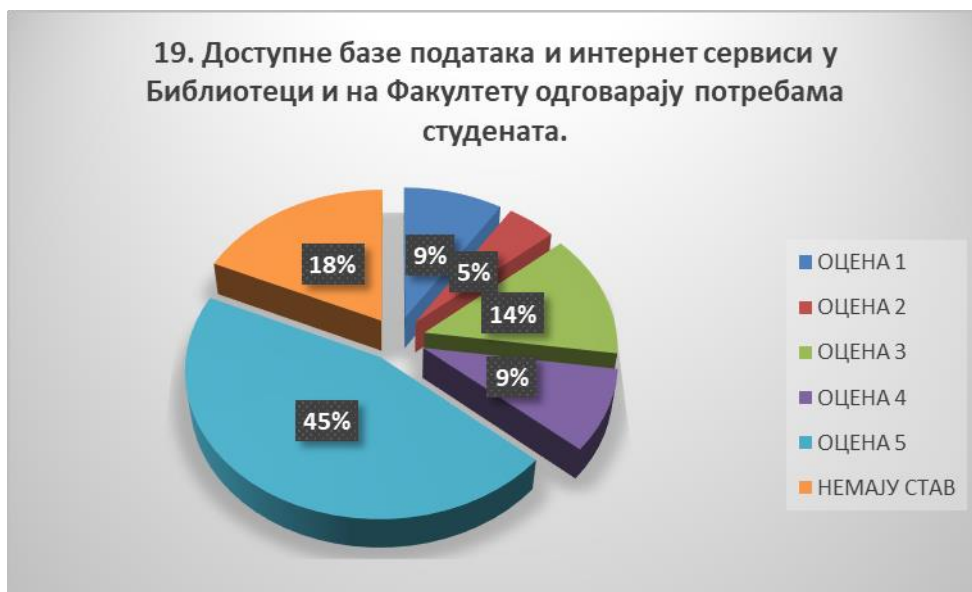
Сл. 3.19 Графикон 19