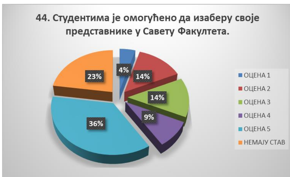
Сл. 3.44 Графикон 44

Општи закључак: Испитивани показатељ квалитета СП је високо оцењен.