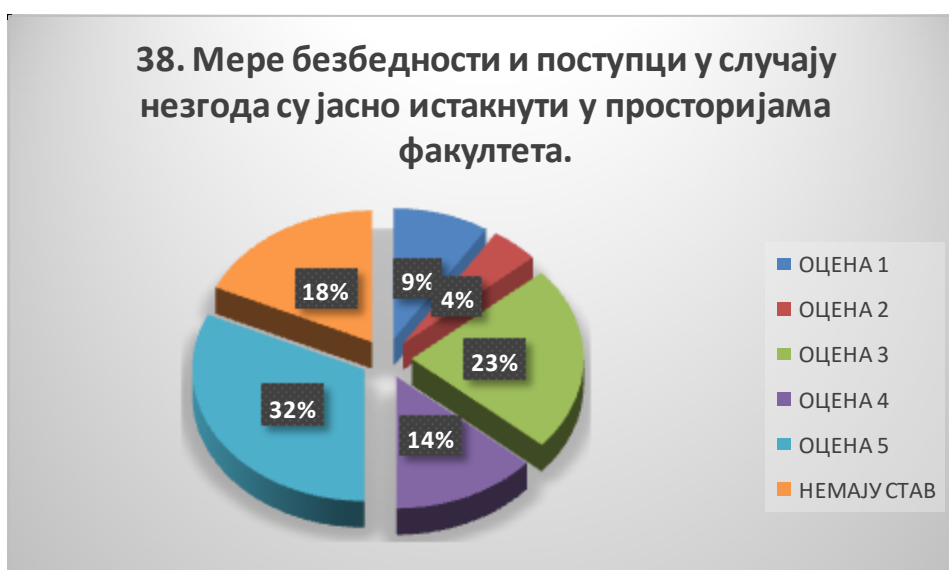
Сл. 3.38 Графикон 38

Општи закључак: Испитивани показатељ квалитета СП је високо оцењен.