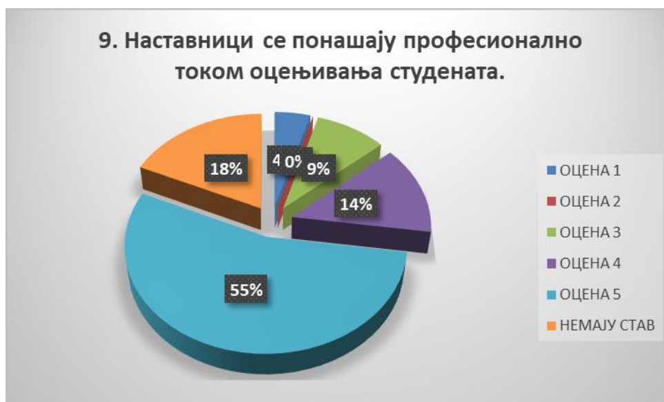
Сл. 3.9 Графикон 9

Општи закључак: Испитивани показатељ квалитета СП је врло високо оцењен.