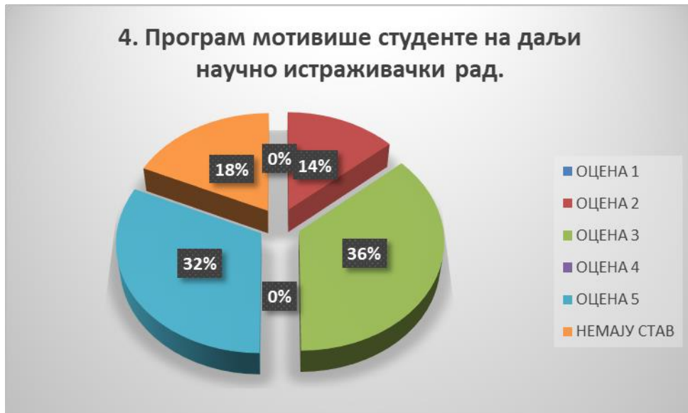
Сл. 3.4 Графикон 4