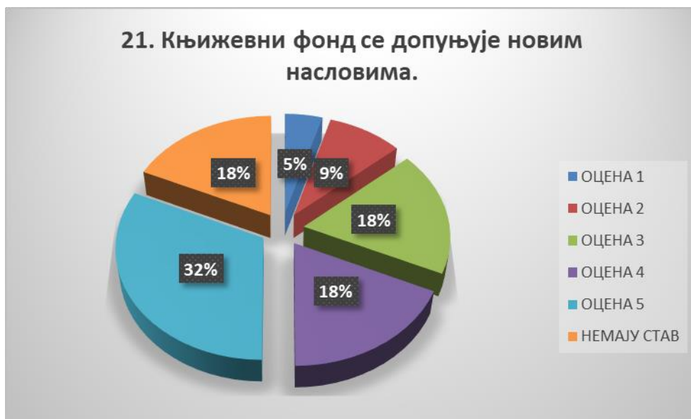
Сл. 3.21 Графикон 21