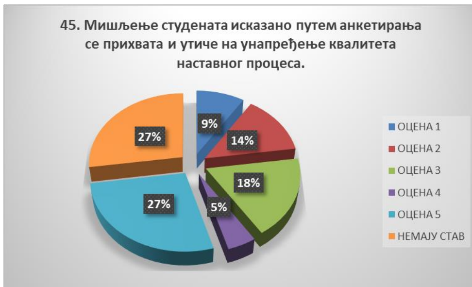
Сл. 3.45 Графикон 45

Општи закључак: Испитивани показатељ квалитета СП је задовољавајуће оцењен.