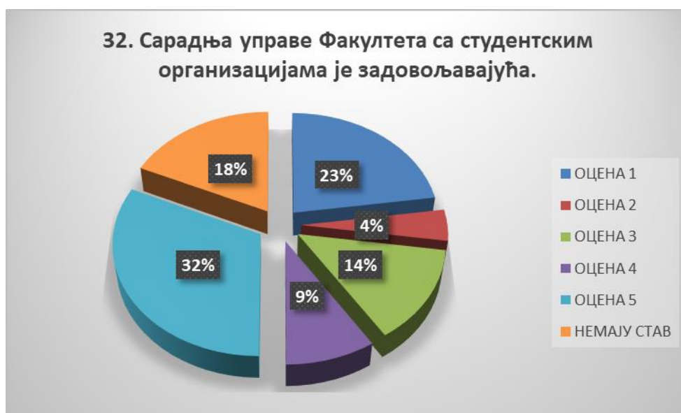
Сл. 3.32 Графикон 32

Општи закључак: Испитивани показатељ квалитета СП је задовољавајуће оцењен.