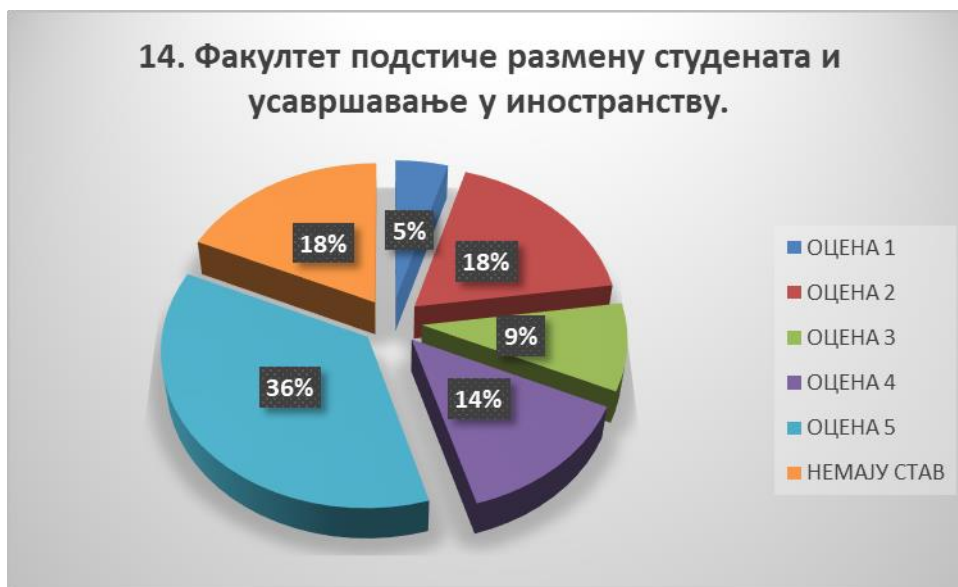
Сл. 3.14 Графикон 14

Општи закључак: Испитивани показатељ квалитета СП је високо оцењен.