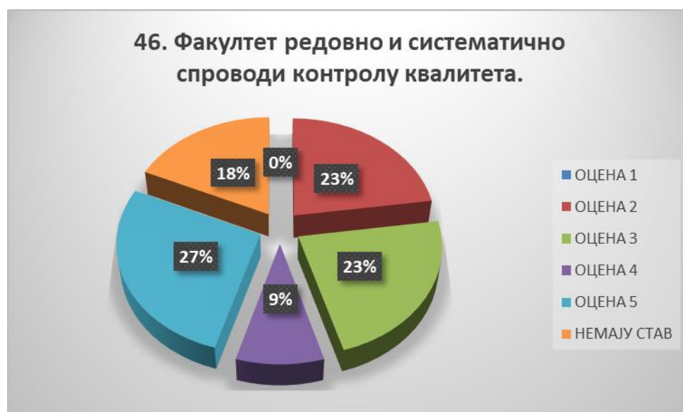
Сл. 3.46 Графикон 46

Општи закључак: Испитивани показатељ квалитета СП је високо оцењен.