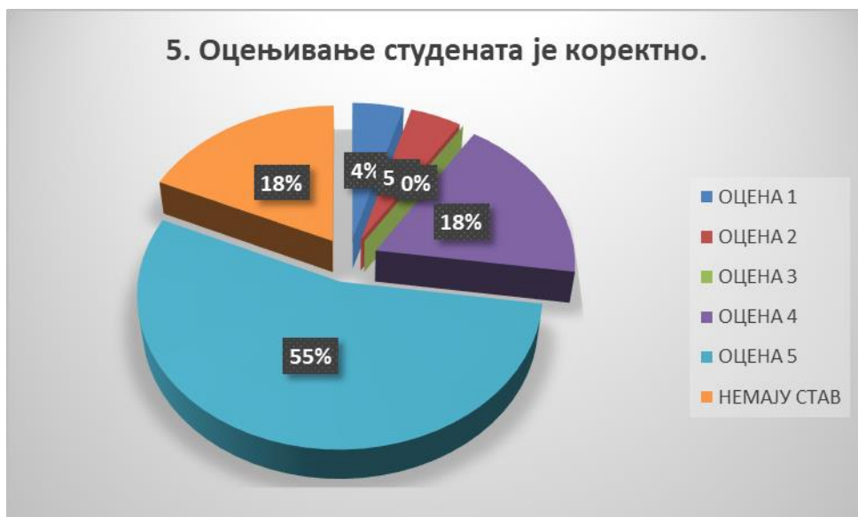
Сл. 3.5 Графикон 5

Општи закључак: Испитивани показатељ квалитета СП је врло високо оцењен.