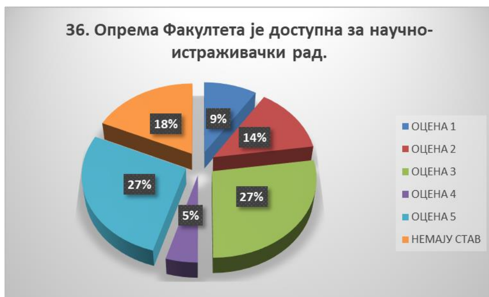
Сл. 3.36 Графикон 36

Општи закључак: Испитивани показатељ квалитета СП је задовољавајуће оцењен.